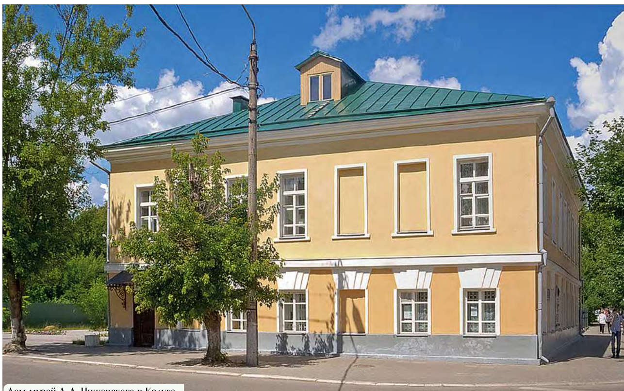
Дом-музей А. Л. Чижевского в Калуге