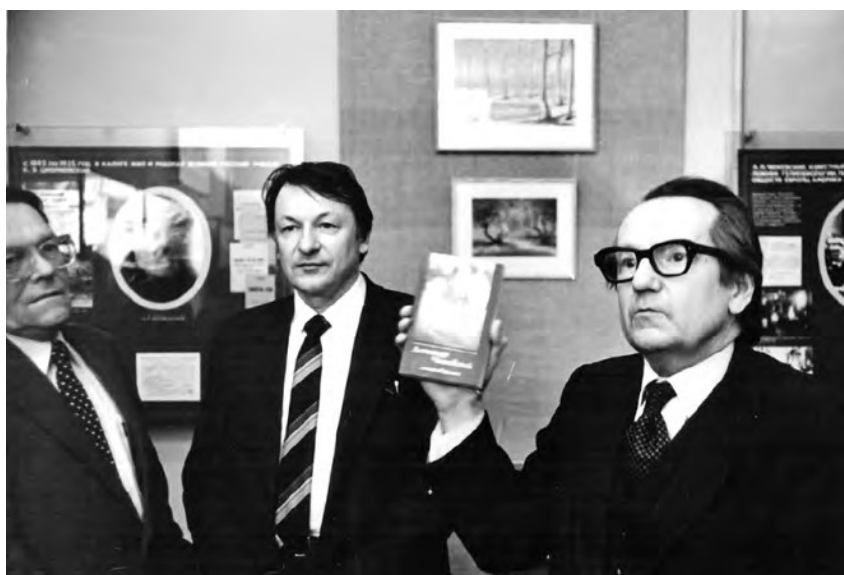
Открытие экспозиции, посвящённой А. Л. Чижевскому, в краеведческом музее. Калуга, 1987 г.