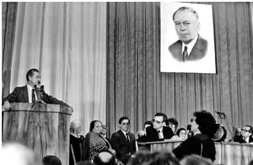
Космонавт В. И. Севастьянов выступает на вечере памяти А. Л. Чижевского. Калуга, 1989 г.