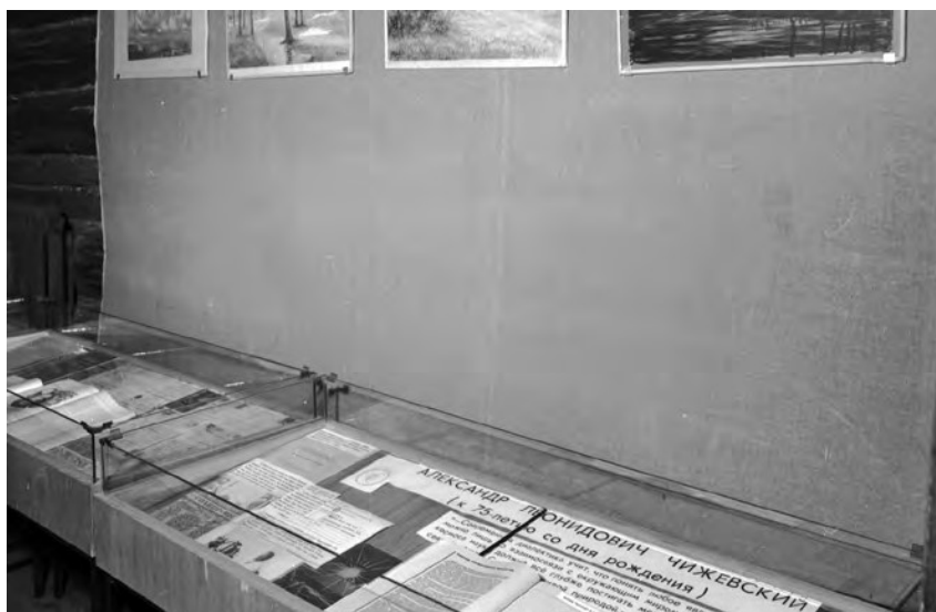
Фрагмент выставки, посвящённой А. Л. Чижевскому, в Доме-музее К. Э. Циолковского. Калуга, 1972 г.

Выдающуюся роль в пропаганде идей учёного и сплочении рядов