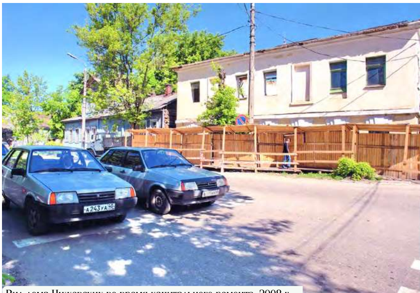
Вид дома Чижевских во время капитального ремонта. 2008 г.