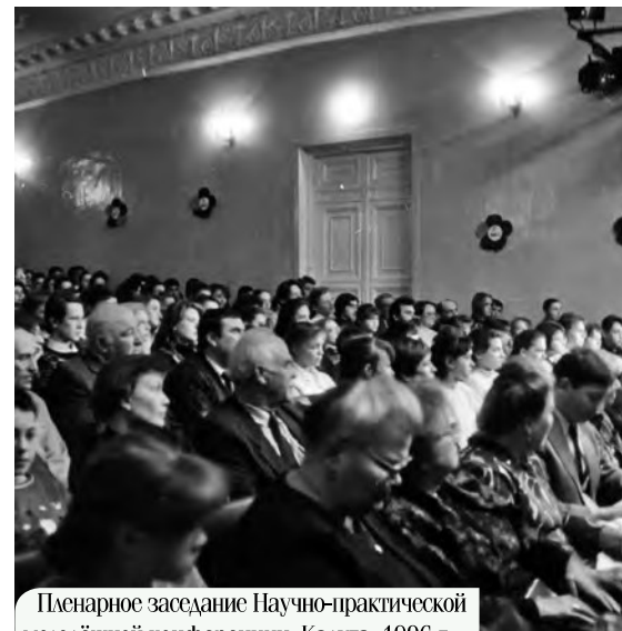
Пленарное заседание Научно-практической молодёжной конференции. Калуга, 1996 г.

В Министерство культуры РСФСР, руководителям Калужской области