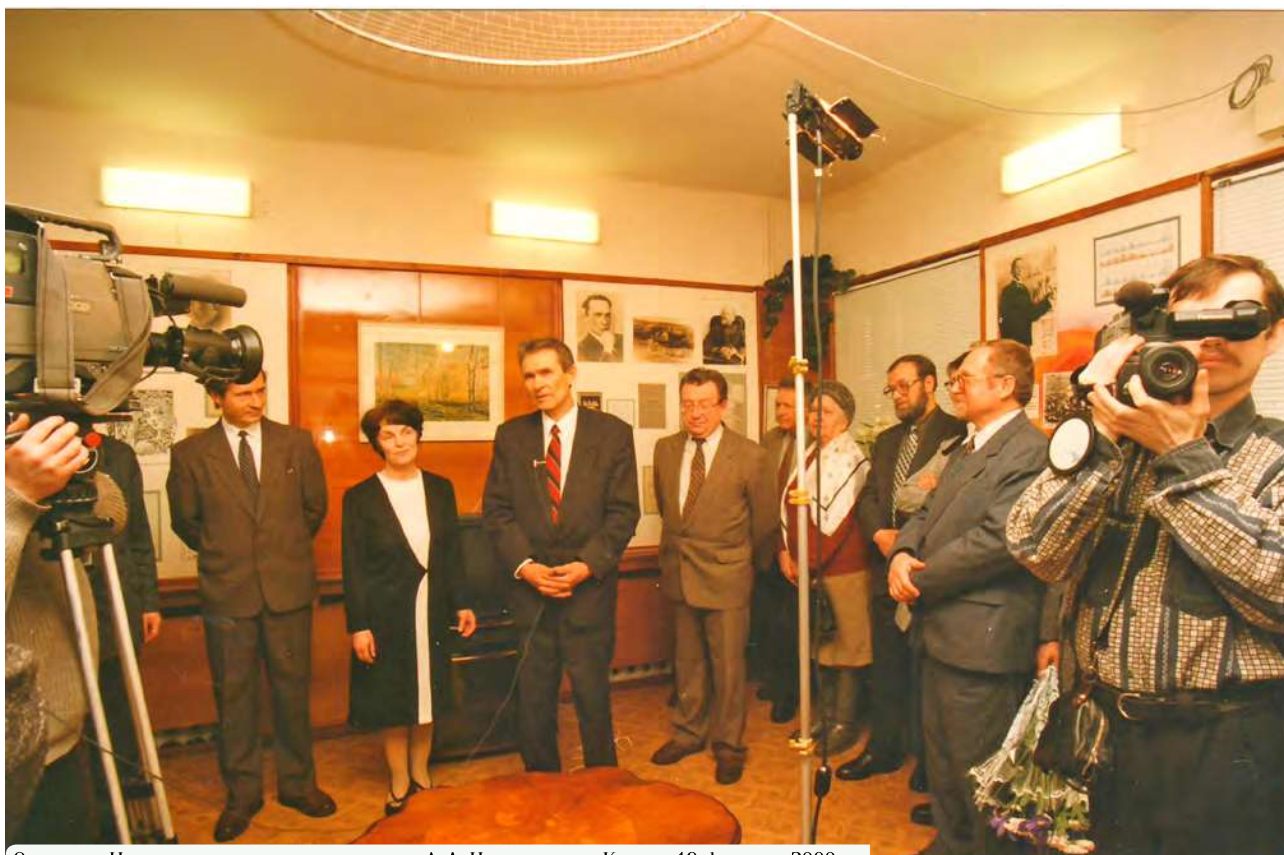
Открытие Научно-просветительского центра А. Л. Чижевского в Калуге. 19 февраля 2000 г.