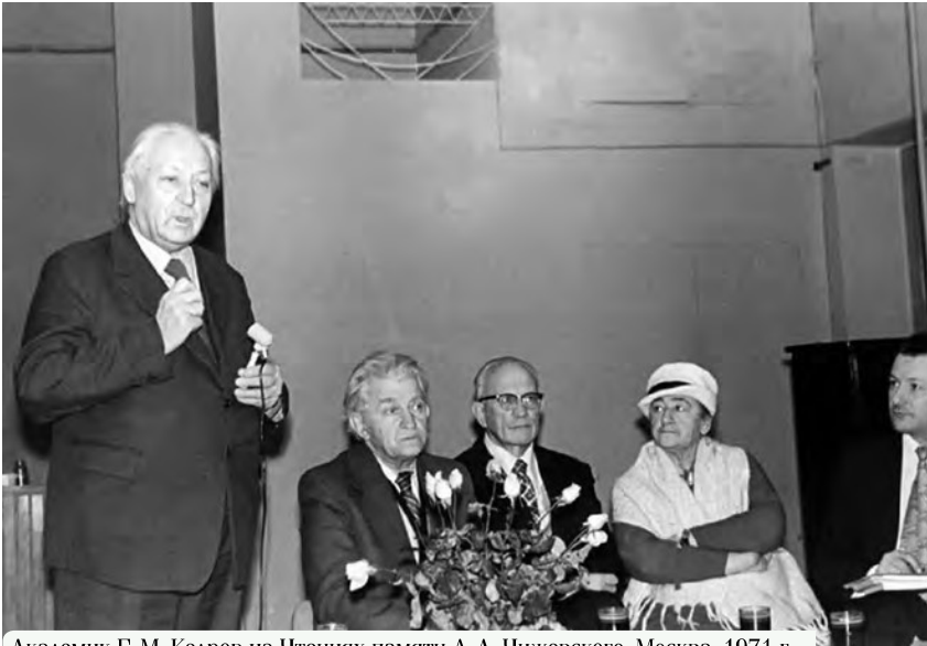
Академик В.М. Кедров на Чтениях памяти А.Л. Чижевского. Москва, 1971 г.