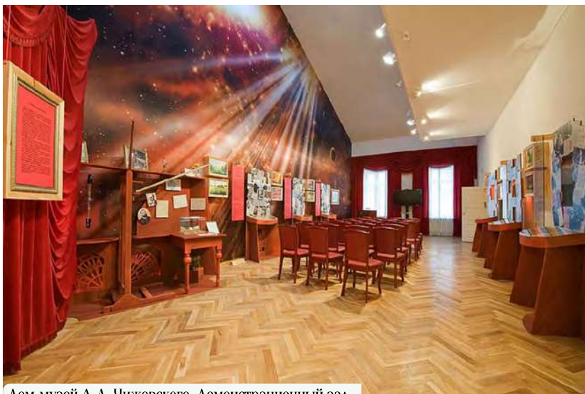
Дом-музей А. А. Чижевского. Демонстрационный зал

избранные труды молодёжных чтений памяти А. Л. Чижевского. Чижевцами установлены тесные плодотворные контакты с Международным центром Рериха, культурно-просветительским обществом «Адамант» (Беларусь), обществом Рериха в Польше; с научными учреждениями — Российским государственным гидрометеорологическим университетом (Санкт-Петербург), Крымской астрономической обсерваторией, ИЗМИРАН (г. Троицк), Пуцинским биологическим центром, Государственным университетом Кыргызстана (г. Бишкек), Мордовским государственным университетом (г. Саранск), а также со многими учёными — продолжателями идей А. Л. Чижевского.