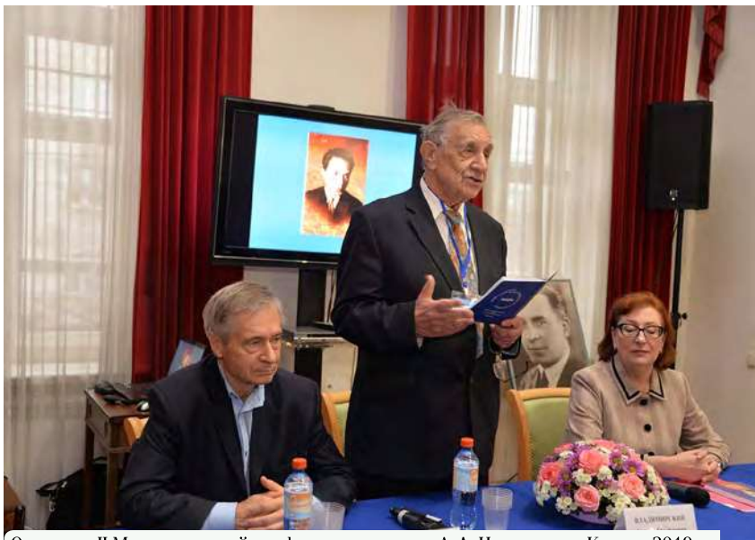
Открытие II Международной конференции памяти А. Л. Чижевского. Калуга, 2019 г.

Начиная с 2017 года в музее проходит Международная научно-практическая конференция, посвящённая сохранению творческого наследия и развитию идей А. Л. Чижевского. В эти дни в музей приезжают учёные, инженеры, писатели, художники, педагоги, музейные сотрудники, студенты.