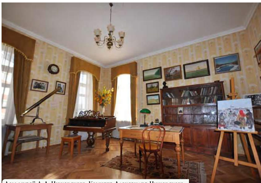
Дом-музей А. А. Чижевского. Комната Александра Чижевского