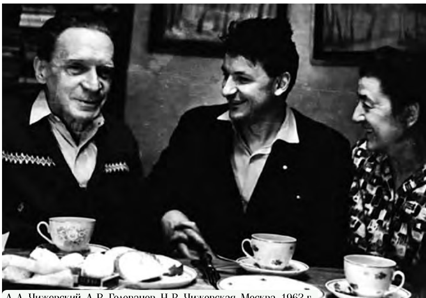
А. Л. Чижевский, А. В. Голованов, Н. В. Чижевская. Москва, 1963 г.